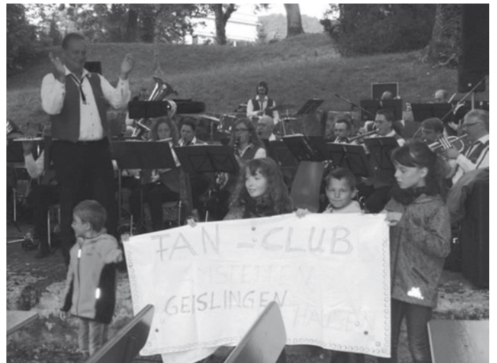
Die Feuerwehrkapelle Amstetten

Es hat uns sehr gefreut für euch und alle anderen Zuhörer spielen zu dürfen.