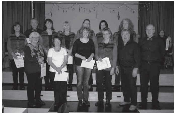
(auf dem Foto fehlt: Helga Hofelich)

Außerdem konnte Dirigent Dieter Schleppe für 20-jährige Dirigentenschaft im ersten Orchester geehrt werden.